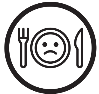
Pérdida del gusto u olfato

SI TIENE ALGUNO DE ESTOS SÍNTOMAS, ¡QUÉDESE EN CASA!